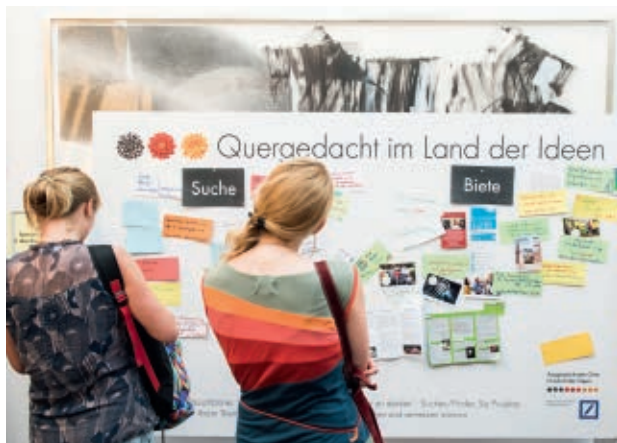
Quergedacht im Land der Ideen.