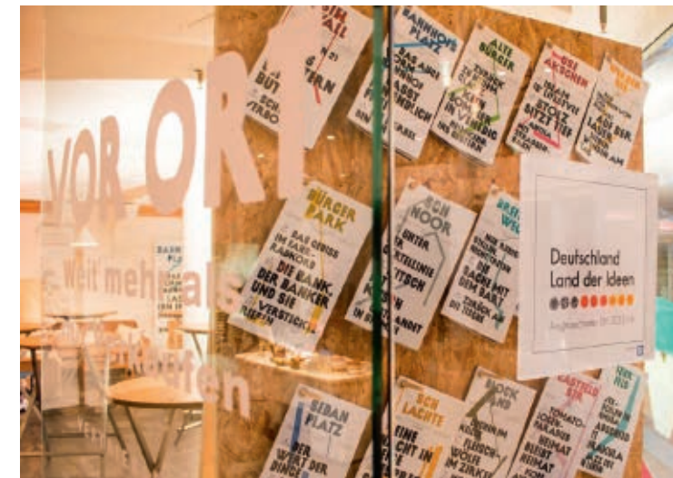
Für jeden sichtbar: Deutschlands Zukunftsmacher