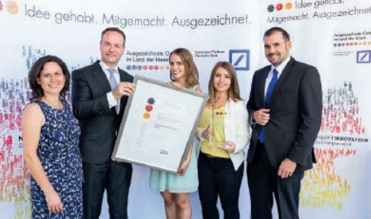
Preisverleihung von „Koblenz lernt e. V.“