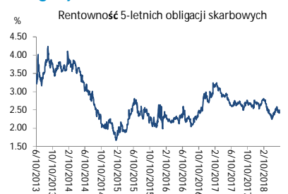
Wykres 3. Długoletni trend – obligacje 5-letnie SP