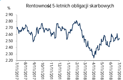
Wykres 2. Rentowność 5-letnich obligacji skarbowych