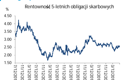
Wykres 3. Długoletni trend – obligacje 5-letnie SP