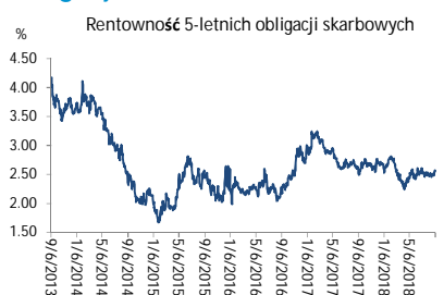
Wykres 3. Długoletni trend – obligacje 5-letnie SP