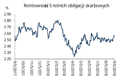
Wykres 2. Rentowność 5-letnich obligacji skarbowych