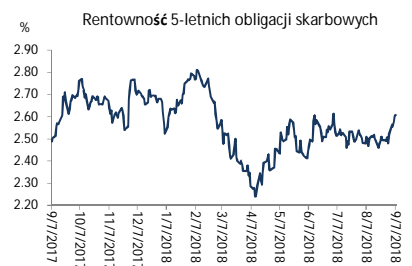
Wykres 2. Rentowność 5-letnich obligacji skarbowych