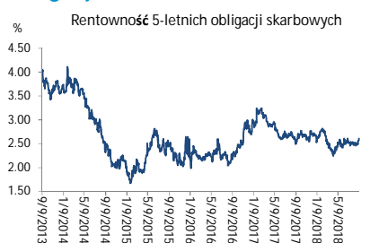
Wykres 3. Długoterminny trend – obligacje 5-letnie SP