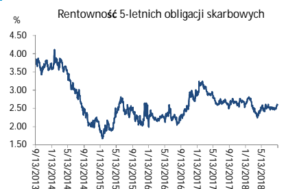
Wykres 3. Długoletni trend – obligacje 5-letnie SP