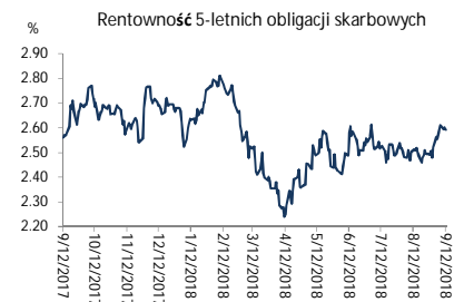
Wykres 2. Rentowność 5-letnich obligacji skarbowych