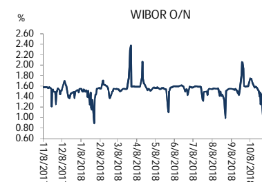
Wykres 1. WIBOR O/N