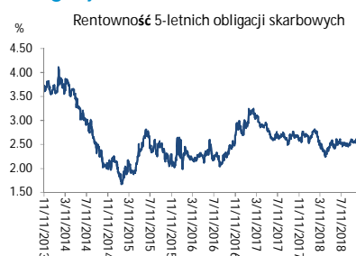
Wykres 3. Długoletni trend – obligacje 5-letnie SP