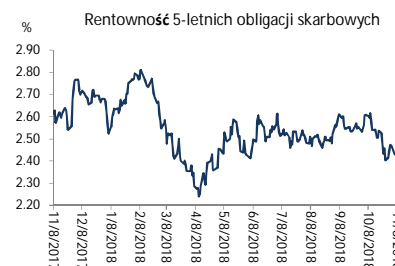
Wykres 2. Rentowność 5-letnich obligacji skarbowych