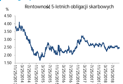
Wykres 3. Długoletni trend – obligacje 5-letnie SP