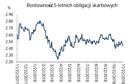
Wykres 2. Rentowność 5-letnich obligacji skarbowych