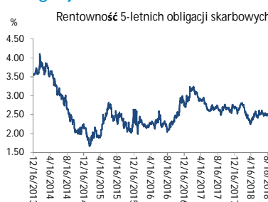
Wykres 3. Długoterminny trend – obligacje 5-letnie SP