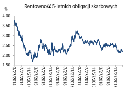
Wykres 3. Długoletni trend – obligacje 5-letnie SP