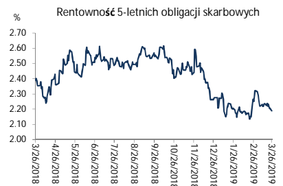
Wykres 2. Rentowność 5-letnich obligacji skarbowych