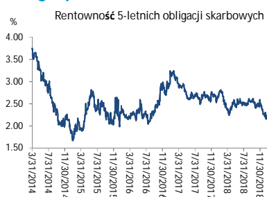
Wykres 3. Długoletni trend – obligacje 5-letnie SP