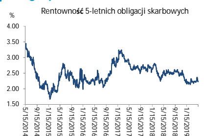
Wykres 3. Długoletni trend – obligacje 5-letnie SP