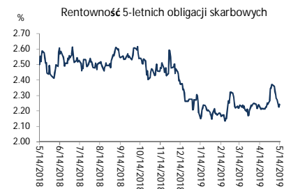
Wykres 2. Rentowność 5-letnich obligacji skarbowych