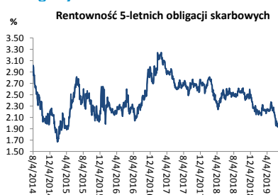
Wykres 3. Długoletni trend – obligacje 5-letnie SP