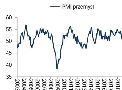
Wykres 1. PMI przemysł

We środę Rada Polityki Pieniężnej kończy dwudniowe posiedzenie decyzyjne. Po niskiej inflacji i spadku indeksu PMI w grudniu RPP, jest bardzo prawdopodobne, że Rada utrzyma stopy procentowe bez zmian w 2019r.